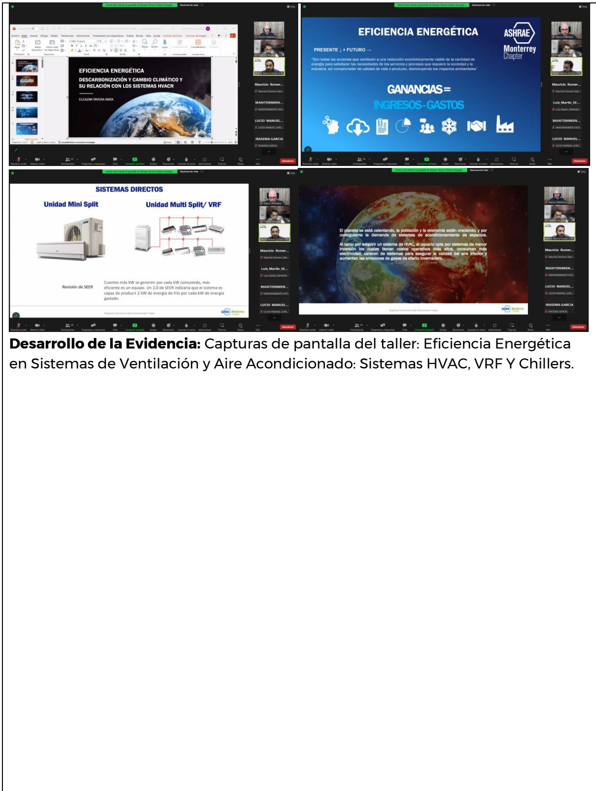
Desarrollo de la Evidencia: Capturas de pantalla del taller: Eficiencia Energética en Sistemas de Ventilación y Aire Acondicionado: Sistemas HVAC, VRF Y Chillers.