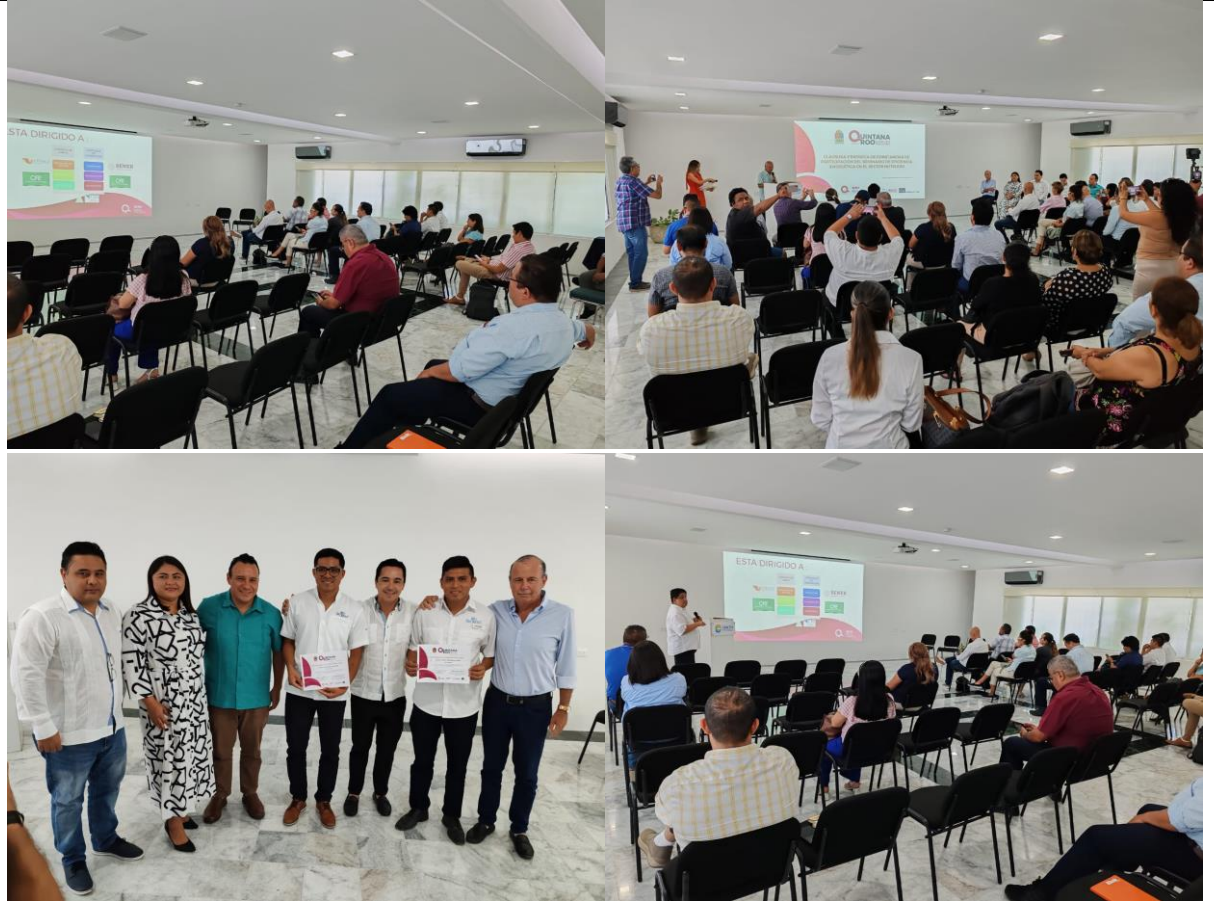
Desarrollo de la Evidencia: Fotografías de la capacitación/Taller: Código de Red 2.0 y sus Implicaciones: Obligaciones, Multas y Sanciones