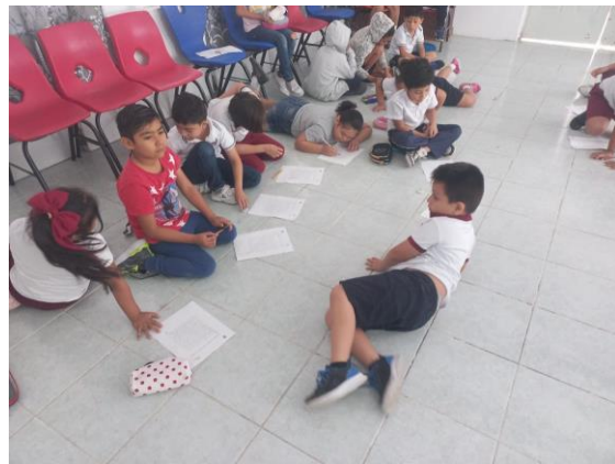
Estudiantes de la escuela primaria "Jesús Cetina Salazar", beneficiados con pláticas de sensibilización y concientización ambiental.