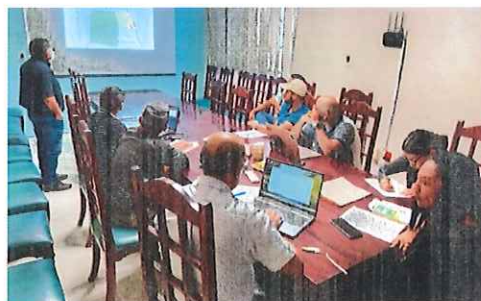
Reunión del Comité Técnico de Manejo Forestal