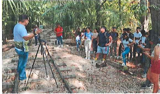
Capacitación de inventario de mapeo urbano en las instalaciones del Zoológico Payo Obispo de Chetumal, Quintana Roo