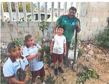
Programa de Reforestación con los alumnos y docentes de la Escuela Primaria Melchor Ocampo de la Localidad de Calderitas, Othón P. Blanco