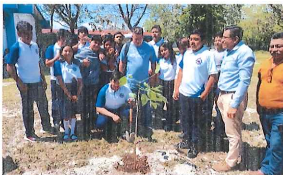
Programa de Reforestación con los alumnos del CETMAR No. 10, Chetumal, Quintana Roo.