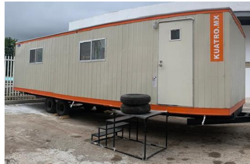
Fig. 1.- Copia simple de algunas hojas del contrato de adquisición de equipamiento móvil para la Educación Ambiental en el Parque Zazil del Municipio de Othón P. Blanco y fotografía del equipamiento adquirido