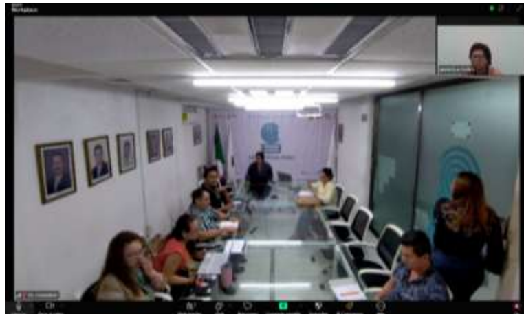
Fig 5.- Video conferencia del Programa Estatal del SMA a personal de la Dirección General del COBAQROO.