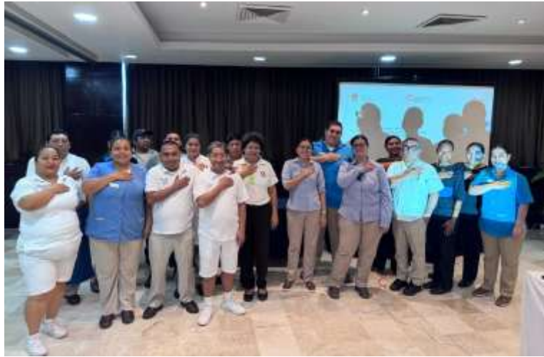
fig. 4.- Plática de separación de residuos sólidos en el Hotel Krystal.