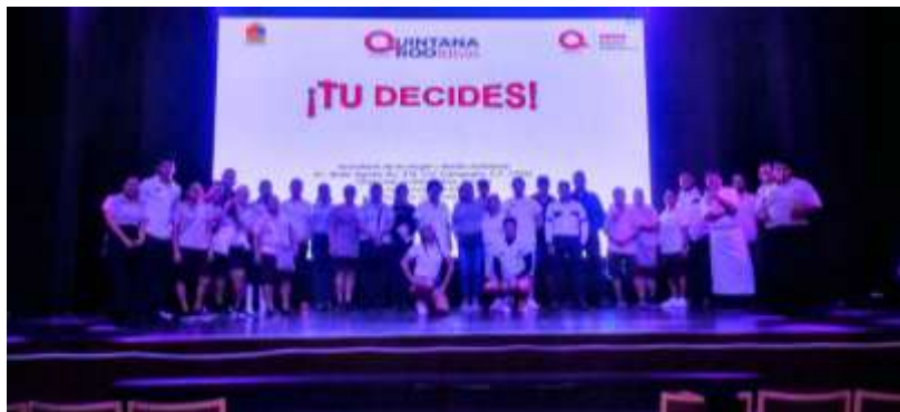
Fig.2.- Plática de buenas prácticas ambientales en el hotel Royal Solaris.