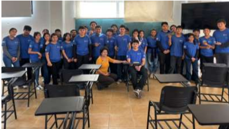
Fig.1.- Plática de especies en peligro de extinción en Ciudad de la Alegría.