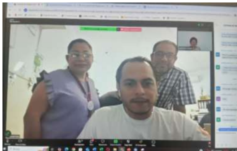
Fig 6.- Video-conferencia del Programa Estatal del SMA a personal de la Administración Portuaria Integral de Quintana Roo (APIQROO).