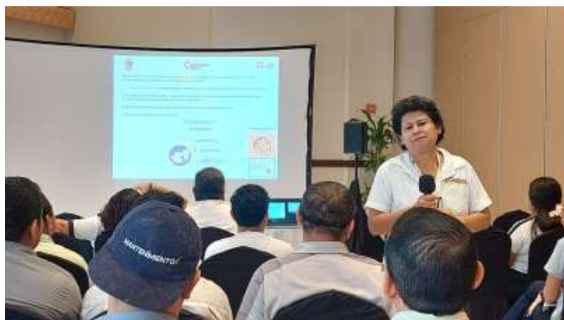
Fig.3.- Plática de buenas prácticas ambientales en el hotel Gr Solaris.