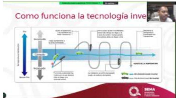
Fig 6.- Video-conferencia de eficiencia energética a personal de la Dirección General del Consejo Quintanarroense de Humanidades, Ciencias y Tecnología (CQHICYT).