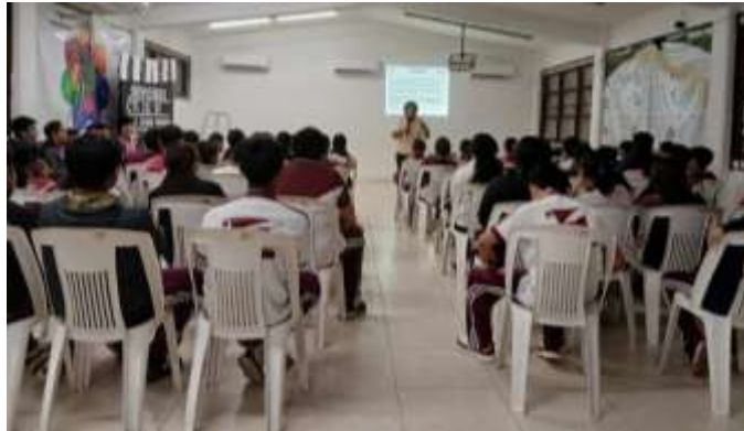
Fig. 1.- Impartición de la plática: Especies en Peligro de Extinción a estudiantes de la Escuela Secundaria Técnica No. 31.