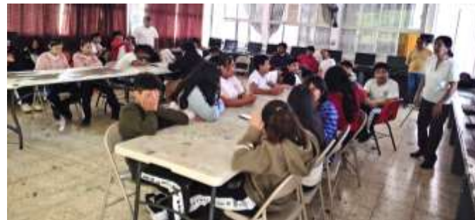
Fig. 3.- Impartición de la plática: Los Humedales y los Conocimientos Tradicionales a estudiantes de la Escuela Secundaria No. 13.