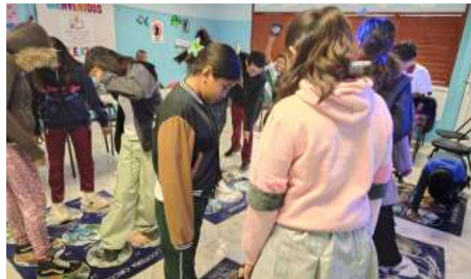
Fig. 2.- Estudiantes de la Escuela Primaria "Ignacio Herrera López", ponen en práctica los conocimientos adquiridos.