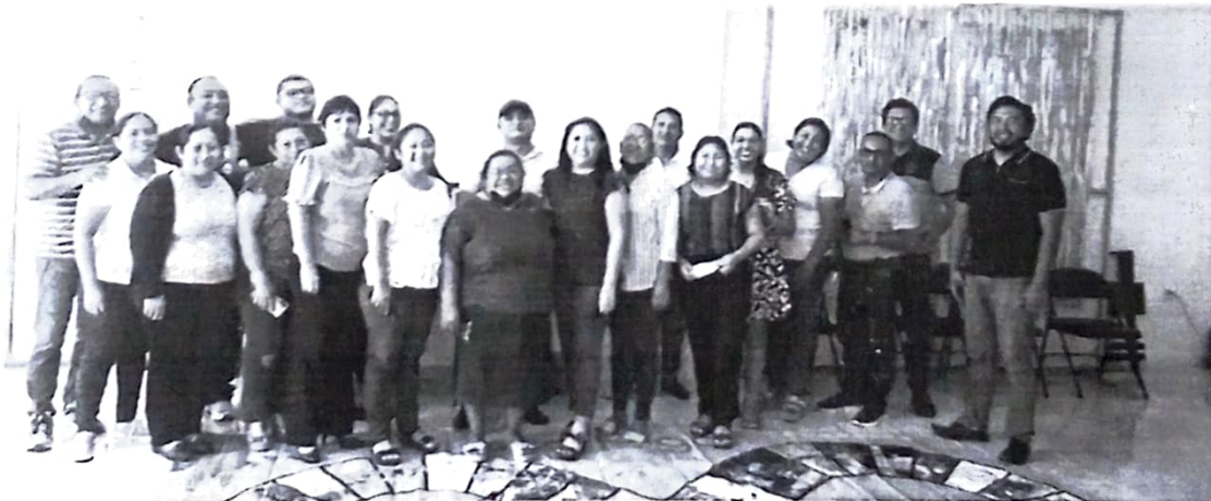
Entrega de Distintivo al Instituto Quintanarroense de la Mujer (IQM)