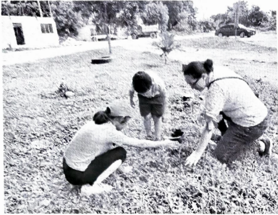
Municipio de Isla Mujeres