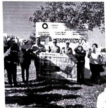
Municipio de Solidaridad