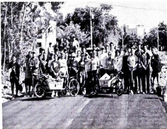
Municipio de Puerto Morelos