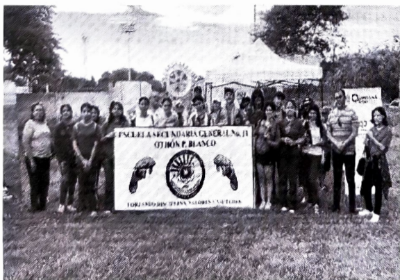
Municipio de Othón P. Blanco