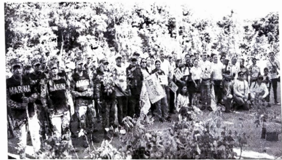
Municipio de Cozumel