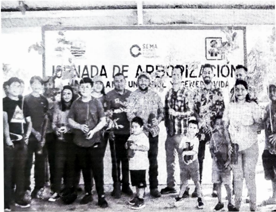
Municipio de Lázaro Cárdenas