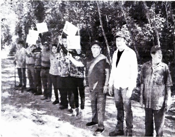
Municipio de José María Morelos