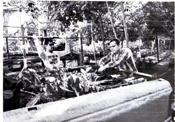
Carga de plantas.