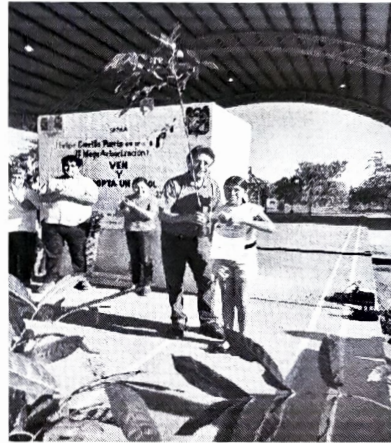
Municipio de Felipe Carrillo Puerto