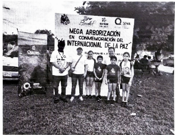
Municipio de Bacalar