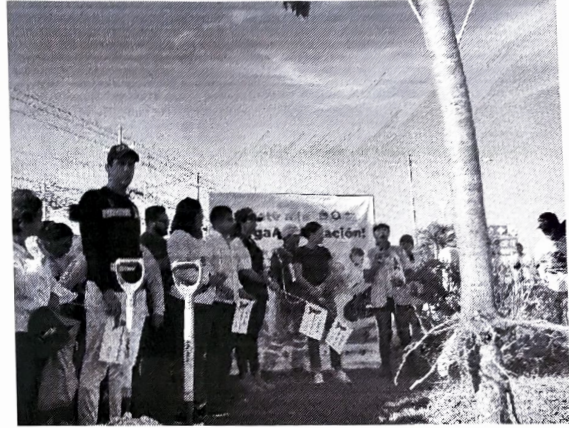
Municipio de Benito Juárez