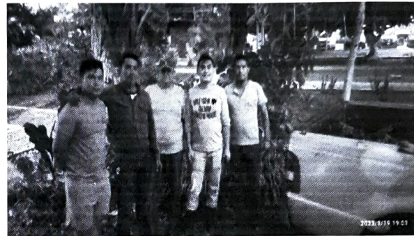
Entrega de plantas.