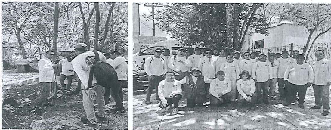
Capacitación del Programa Estatal de Inventario y Mapeo de Arbolado Urbano en Quintana Roo.