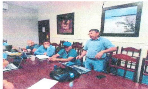
Reunión de la Tercera Sesión del Comité Forestal para emitir opinión técnica del proyecto del Ejido de Noh Bec, Felipe Carrillo Puerto.