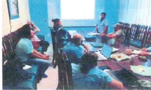
Reunión de la Tercera Sesión del Comité Forestal para emitir opinión técnica del proyecto del Ejido de Santa Isabel, Felipe Carrillo Puerto.