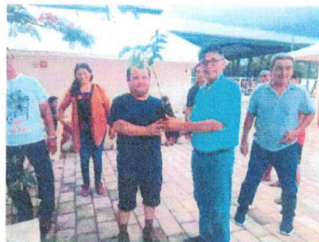
Jornada de Reforestación con alumnos de la UAQROO Unidad Felipe Carrillo Puerto y el Municipio de Ecología del Ayuntamiento, Felipe Carrillo Puerto, Quintana Roo.