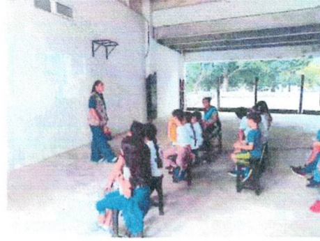
Taller de Reforestación con niños del curso de verano del Zoológico Payo Obispo, Othón P. Blanco, Quintana Roo