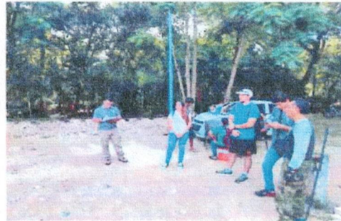
Capacitación de inventario de mapeo urbano en las instalaciones del Zoológico Payo Obispo de Chetumal, Quintana Roo