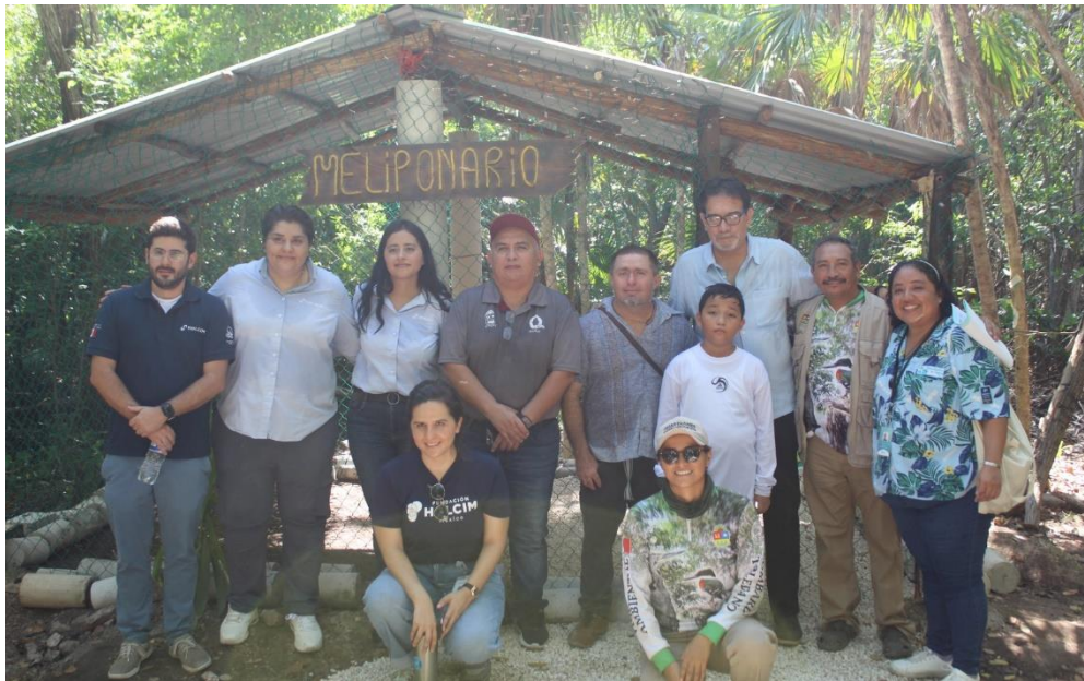
Fig 6. Personal de la SEMA participa en evento realizado en la Laguna Manatí, en conmemoración del Día Internacional de la Conservación del Ecosistema de Manglares. 26/07/24.