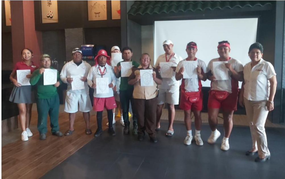
Fig. 5. Personal de la SEMA Lleva a cabo pláticas de Tortugas Marinas en el Hotel Riu Latino. 25/07/24.