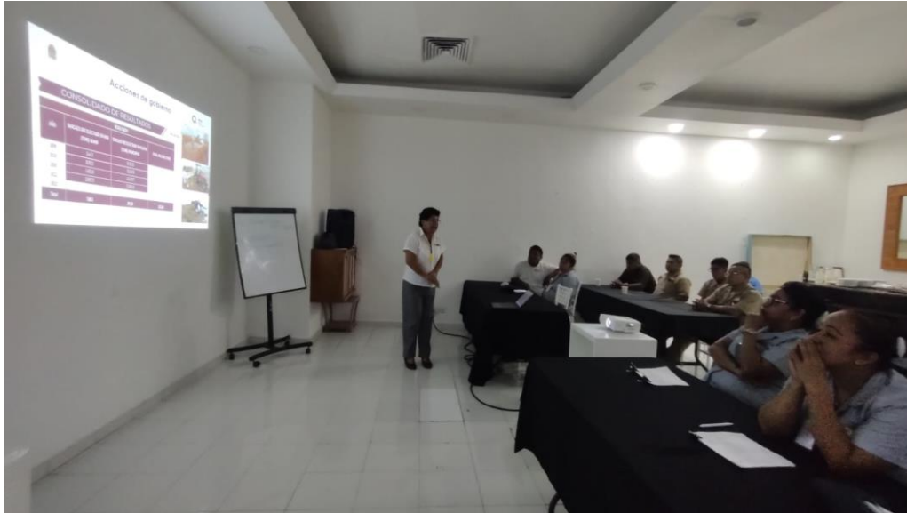
Fig. 2. Personal de la SEMA Imparte la plática “Sargazo en el Caribe”. Hotel Royal Sunset. 16/07/24.