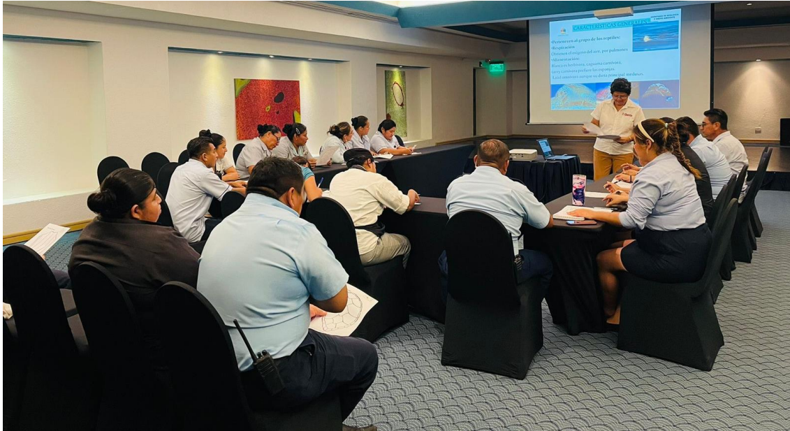
Fig. 9. Personal de la SEMA imparte la plática Tortugas Marinas en el Hotel Costa Occidental. 23/09/24.