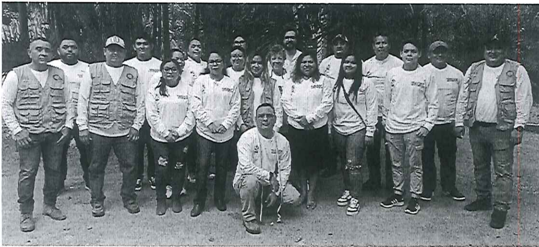
Capacitación del Programa Estatal de Inventario y Mapeo de Arbolado Urbano en Quintana Roo.