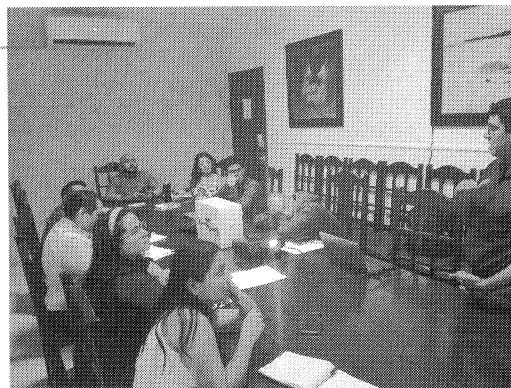
Fotografía de la capacitación en Chetumal

Siendo 14:00 horas se clausura la reunión de trabajo, advirtiéndose la presencia ininterrumpida de los ciudadanos citados en el proemio de la minuta y para debida constancia, así como los efectos procedentes, se levantó la presente minuta que consta de tres fojas útiles, para lo cual se levantó la lista de asistencia que se anexa al presente documento.