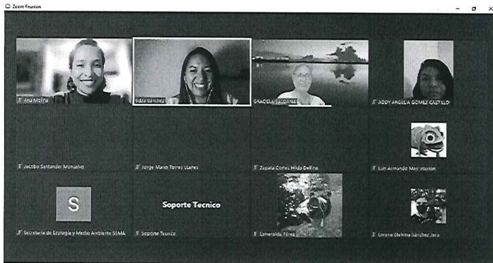
Evidencia fotográfica de plática "El colorido aliado del Sistema Arrecifal Mesoamericano: el pez loro", 31 de marzo del 2022.