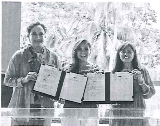
Firma de Convenio de Colaboración entre el Gobierno del Estado de Quintana Roo y la representante en México del Programa de las Naciones Unidas para el Medio Ambiente (PNUMA), en el marco del evento conmemorativo del Día Mundial del Medio Ambiente 2023.