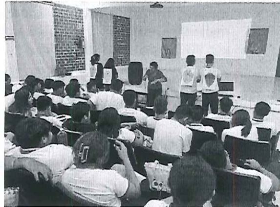
Impartición de la plática de sensibilización "Conociendo a las Tortugas Marinas", realizada en el marco de la 7ma Semana Estatal de la Tortuga Marina.