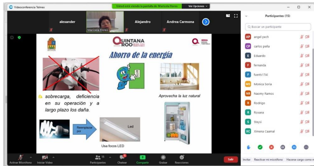
Fig. 2.- Capacitación en materia de Buenas Prácticas Ambientales en el Instituto de la Juventud.