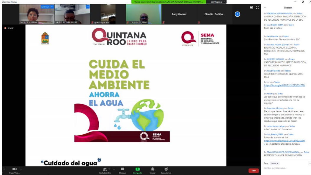
Fig. 1.- Capacitación al personal de la SSC en el Sistema de Manejo Ambiental con el tema cuidado del agua.