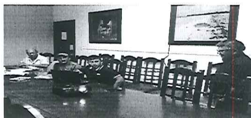
Integrantes del Comité técnico de Manejo forestal.