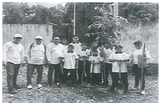
Se realizaron actividades de Arborización instalaciones de la Escuela Secundaria Técnica No. 15 "José Marrufo Hernández", con la participación de los alumnos de los grados Primero A, B y C.