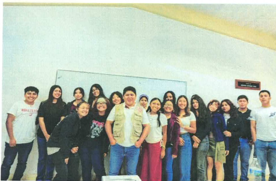
Imagen 2. Plática de sensibilización ambiental "Conociendo la Vida de un Manatí", impartida a estudiantes de la Universidad Pedagógica Nacional, Unidad 231 Chetumal.