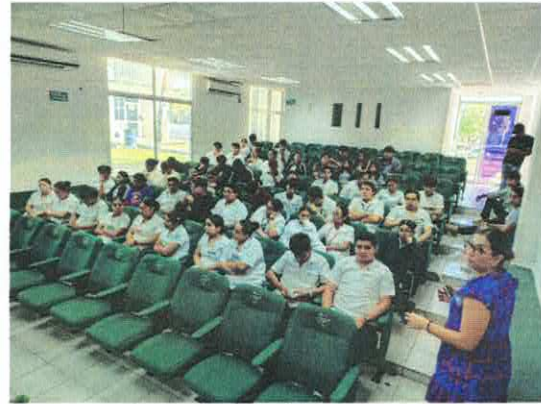
Imagen 6.- En el marco de la campaña estatal Navidad Responsable – La Haces Tú, se impartió la plática de sensibilización ambiental "Consumismo en Navidad" y "Consumo Responsable", a 121 estudiantes del Colegio Nacional de Educación Profesional Técnica (CONALEP) Plantel Chetumal.