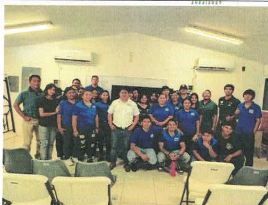
Imagen 3. En el marco de la Semana Nacional de la Conservación se impartió la plática de sensibilización ambiental “Problemática de los Residuos Sólidos en las Áreas Naturales Protegidas”, a 80 estudiantes del Centro de Actualización del Magisterio (CAM) de la ciudad de Chetumal.