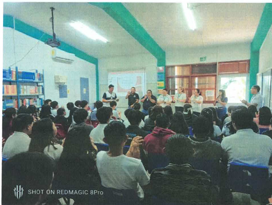
Imagen 1.- Plática de sensibilización ambiental "EcoCiudadanía: Del Aula a la Acción Circular", impartida a estudiantes del Colegio de Bachilleres Plantel Señor, en el municipio de Felipe Carrillo Puerto.